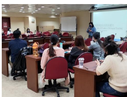
雙語教學設計原則與應用