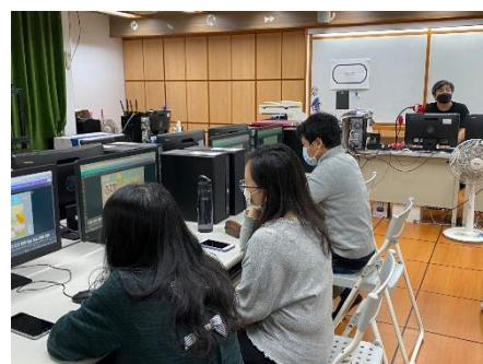
線上虛擬城市佈展建置