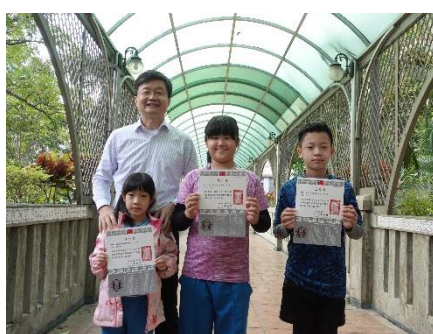
日本世界兒童畫頒獎