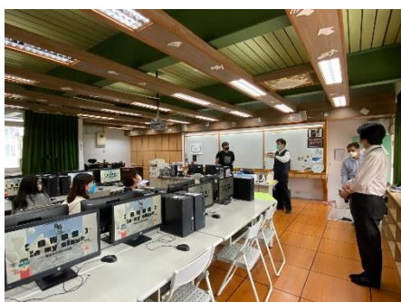
線上虛擬城市佈展建置