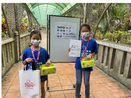
110 學年度臺北市科展競賽