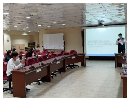
雙語教學設計原則與應用