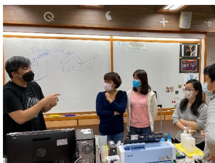
線上虛擬城市佈展建置