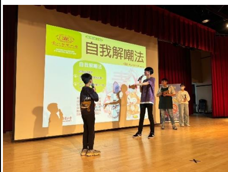
1130321 北醫拒毒宣導活動