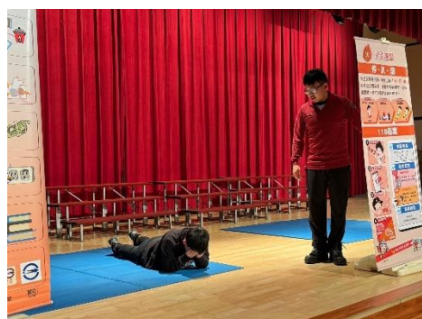
1130301 五年級消防體驗活動