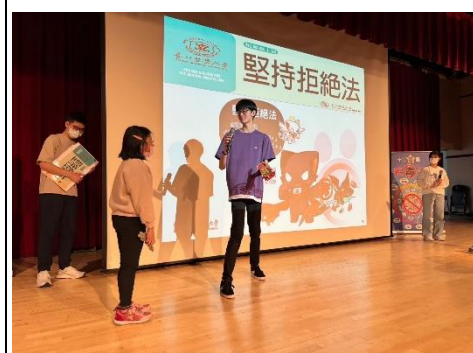
1130321 北醫拒毒宣導活動