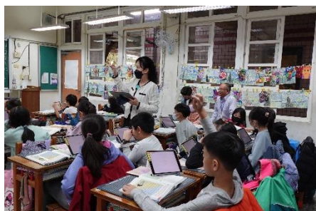
數位學習精進方案公開授課