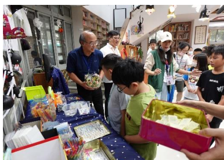
圖書館萬聖節活動