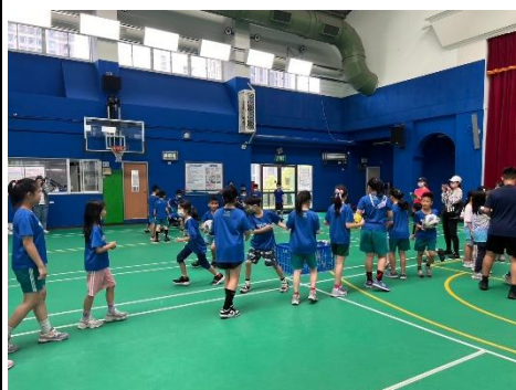
1130503 信義區體育交流活動