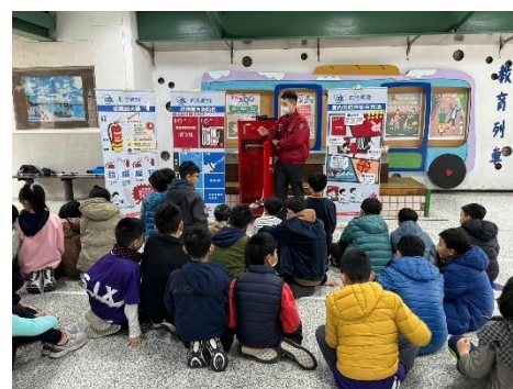
1130301 五年級消防體驗活動