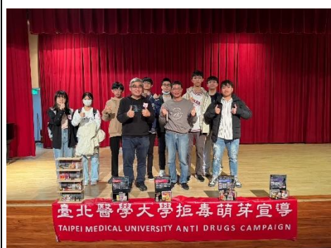
1130321 北醫拒毒宣導活動