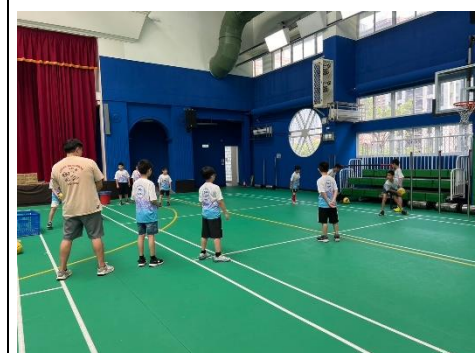
1130503 信義區體育交流活動