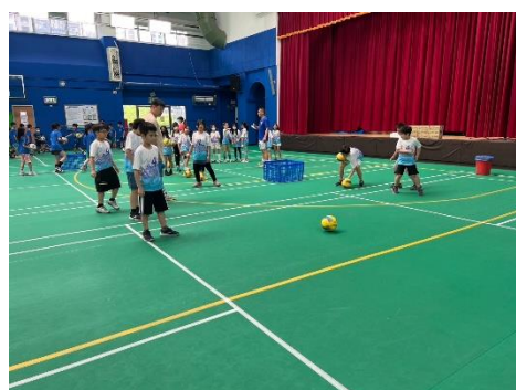
1130503 信義區體育交流活動