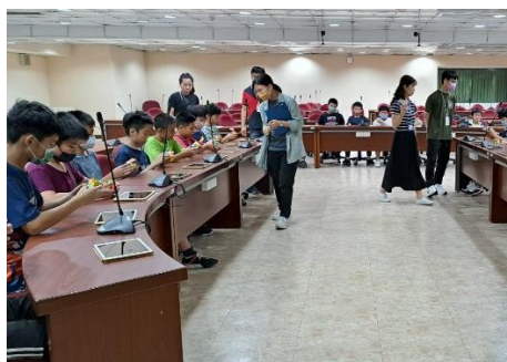
校內魔術方塊比賽