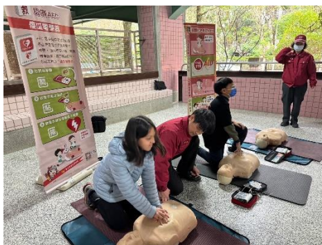
1130301 五年級消防體驗活動