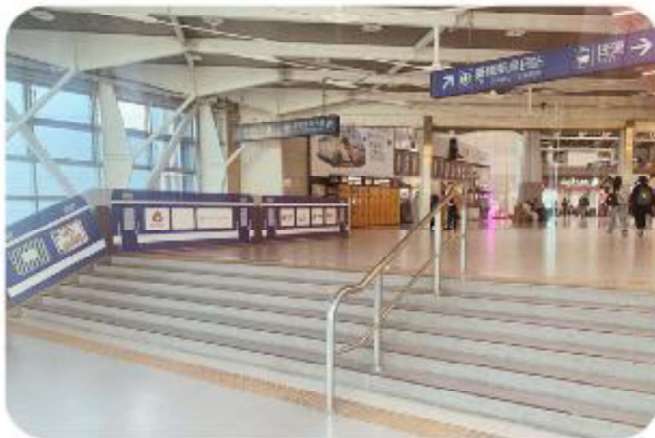
—高鐵往捷運、台鐵 2 樓連通道示意